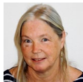
Elna Ørregaard Regnskab